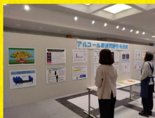
飯豊町町民総合センター

米沢市役所 11月11日(月)～11月15日(金) 飯豊町町民総合センター 11月16日(土)～11月22日(金) 置賜総合支庁(米沢市) 11月18日(月)～11月29日(金)