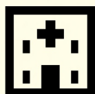
依存症専門 医療機関